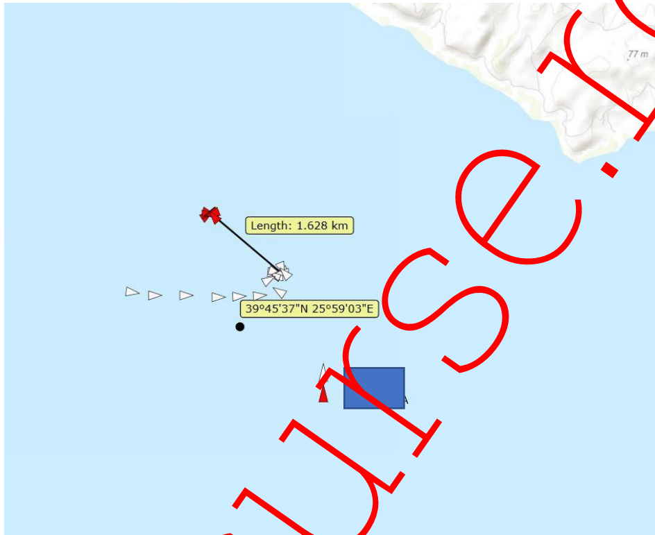
Figura nr. 3 și *** staționează la o distanță de 1,6 Km la intrarea în Strâmtoarea Dardanele în punctul de coordonate 39°45'N/25°59'E

Cu privire la traseul navei *** , în perioada 16.03.2019-18.03.2019 aceasta a navigat pe lângă țărmul vestic al Mării Negre, iar la data de 17.03.2019 , în intervalul orar 12:30-14:19 , nu s-a recepționat semnal A.I.S. (Automated Information System).