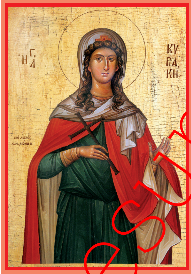
Sfânta Mare Muceniță CHIRIACHI, Ocrotitoarea Episcopiei Hușilor